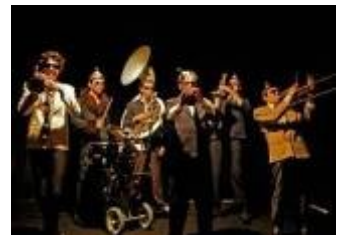
Tous droits réservés

Ils se retrouvent clandestins à la merci de leur chef machiavélique. Un répertoire atomique et original hérité de leur cavale internationale : raï psychédélique, be-bop relifté, funk mécanique ou mambos dégénérés... Sans attaches ni électricité, ils n'épargnent ni l'improvisation libre, ni la musique contemporaine.